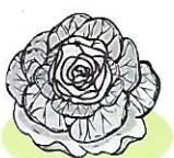
Sa l at